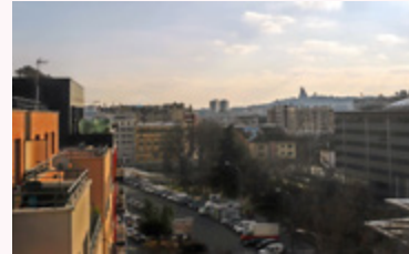
▪ Vue terrasse

Saint-Ouen-sur-Seine bénéficie également d'un environnement agréable grâce au Grand Parc de Saint-Ouen-sur-Seine, implanté sur 12 hectares, qui rejoint la Seine . Véritable lien, le parc relie le centre-ville aux berges. Un authentique lieu de vie et de détente pour tous, qui offre des activités et des voies de circulation douces au cœur de la nature.