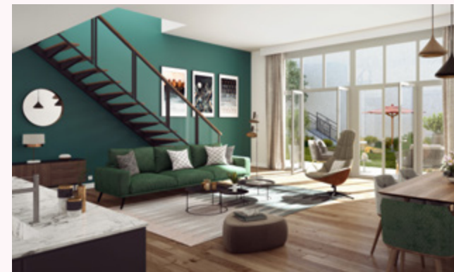
Vue de l'appartement A01