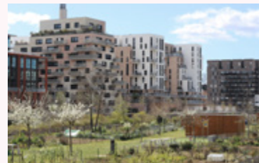
▪ Grand parc