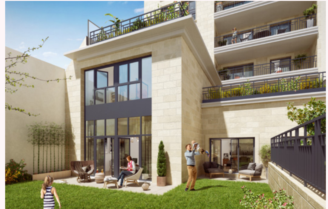
Vue du jardin de l'appartement A01