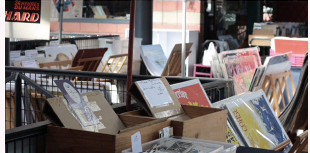
▪ Marché Dauphine (Puces de Paris Saint-Ouen)